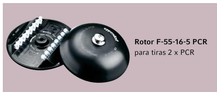
Rotor F-55-16-5 PCR para tiras 2 x PCR