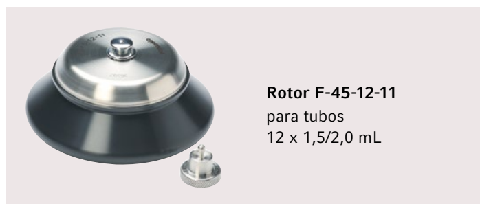
Rotor F-45-12-11 para tubos 12 x 1,5/2,0 mL