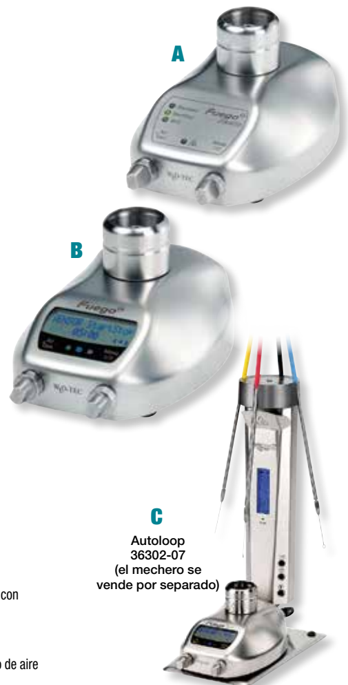
C Autoloop 36302-07 (el mechero se vende por separado)

YV-36302-14 Pedal opcional, de acero inoxidable